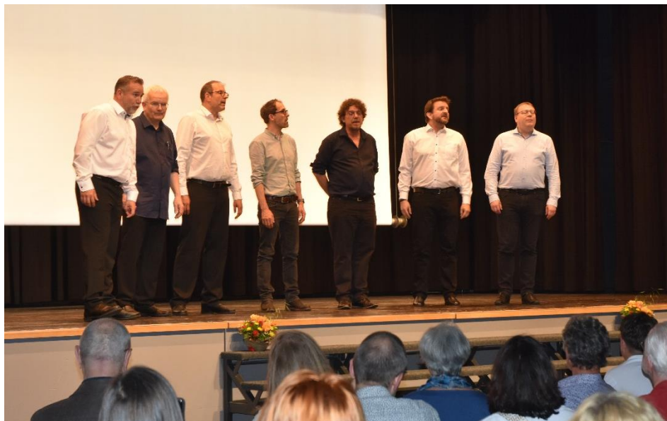
Die Gruppe Integral vitalisiert den Abend a cappella.